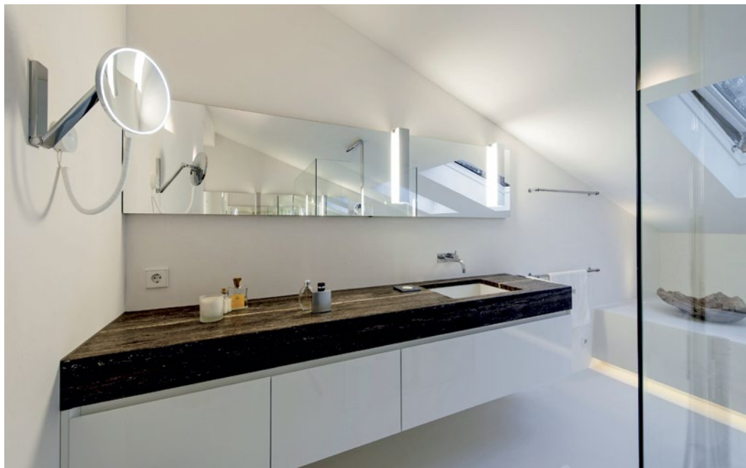
Große Spiegelflächen verleihen dem Badraum optisch Weite.