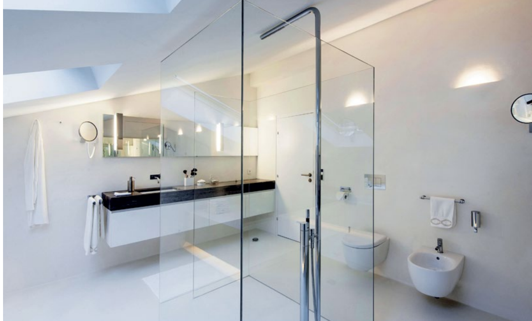
An beiden Stirnseiten hat der Bauherr Waschtische aus Travertin mit viel Ablagefläche montieren lassen.